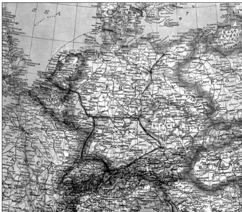
Obr. 3 Rooseveltov návrh okupačných pásiem z novembra 1943.

k Berlínu. Tretí celok sa mal rozprestierať na severovýchode krajiny, pričom Roosevelt ho popísal ako oblasť, kde je dominantným vierovyznaním „prušiactvo“. Pre lepšiu ilustráciu zakreslil ceruzkou svoje predstavy na mapku National Geographic Society (viď. obrázok č.3). Pri následnej prezentácii svojich úvah vojenským predstaviteľom Roosevelt odmietal predstavu obsadiť juhozápadnú časť Nemecka, a tým prevziať zodpovednosť aj za vývoj vo Francúzsku. Bol presvedčený, že Spojené štáty by mali mať priamy prístup k moru cez prístavy Brémy a Hamburg, ktoré ležali v severnej časti krajiny. Do amerického pásma mal patriť aj Berlín. Briti mali podľa Roosevelta obsadiť južnú a Sovietsi východnú časť Nemecka. 182 V tejto súvislosti treba upozorniť na už spomínaný fakt, že o pár dní nato – 1. decembra 1943, predstavil Roosevelt na Teheránskej konferencii úplne