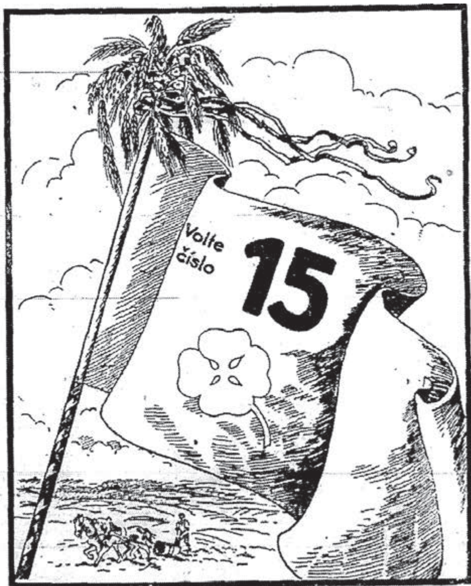
Predvolebná kampaň agrárnej strany z roku 1929 na stránkach Slovenského denníka