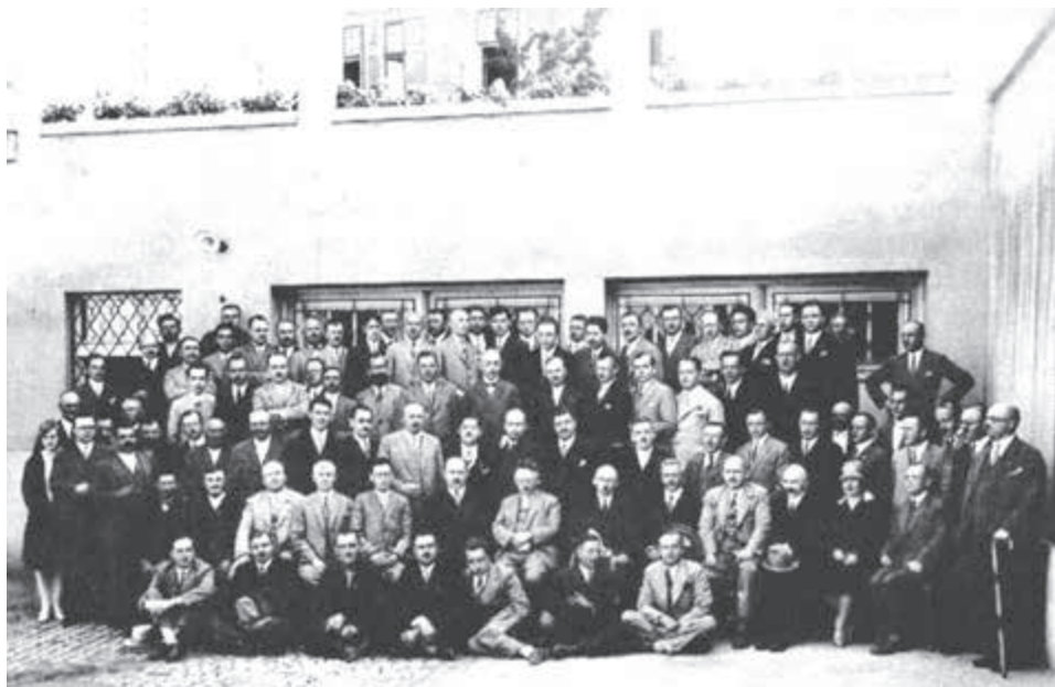
Valné zhromaždenie Zväzu Roľníckych vzájomných pokladníc z roku 1927 v Bratislave (v druhom rade šiesty zľava M. Hodža, ďalej A. Štefánek a J. Ursíny)