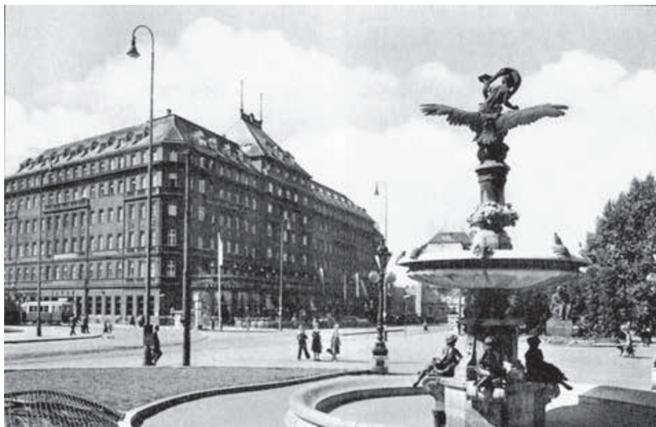
Pohľad na bratislavský hotel Carlton, ktorý bol v 20. rokoch minulého storočia najčastejším miestom neformálnych rokovaní Hodžovho neoficiálneho slovenského vedenia agrárnej strany.