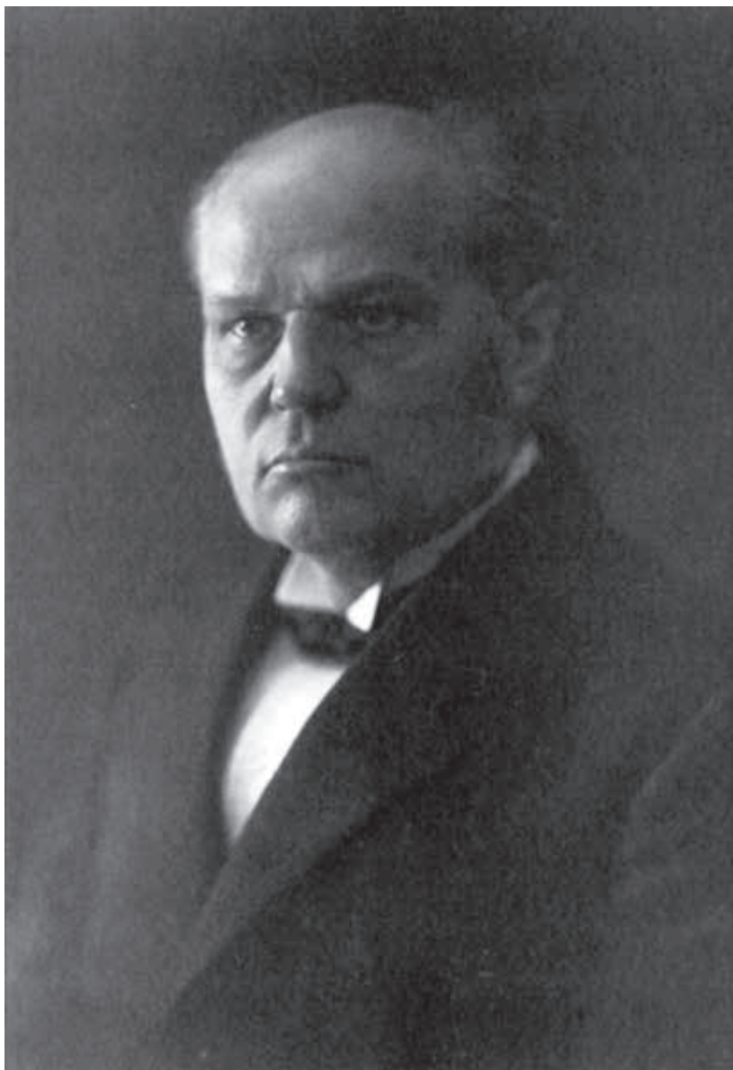
Dlhoročný predseda českej a neskôr i československej agrárnej strany Antonín Švehla