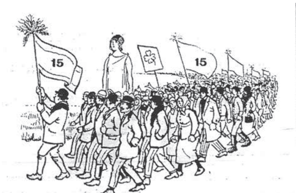
Predvolebná kampaň agrárnej strany z roku 1929 na stránkach Slovenského denníka