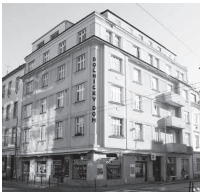
Prvým sídlom centrály Zväzu Roľníckych vzájomných pokladníc bol Roľnícky dom na Dunajskej ulici v Bratislave.